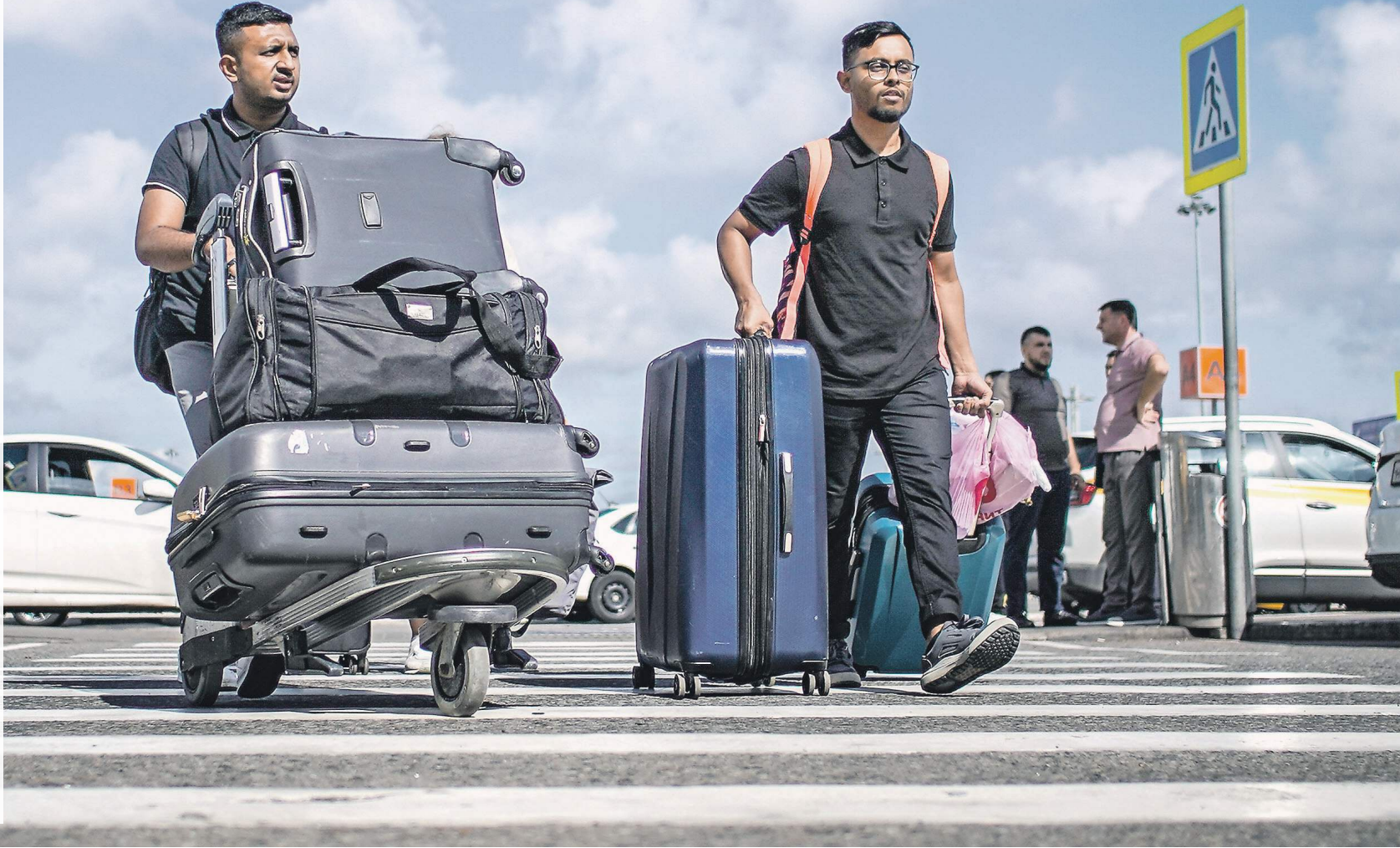
Сергей Лавочкин / Известия