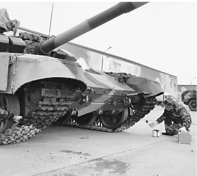
Хороший солдат знает каждую облупленную деталь своего танка

— Как такового единого регламента в нанесении камуфляжа сейчас нет. Есть различ-