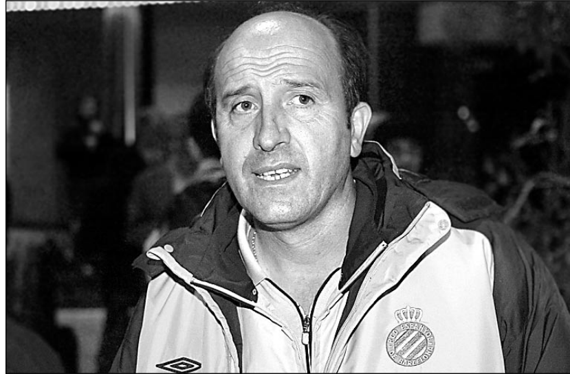
Вчера. Москва. Гостиница «Международная». Главный тренер «Эспаньола» Анхель ЛОТИНА дает интервью «СЭ».

Глеб КОСАКОВСКИЙ из гостиницы «Международная»