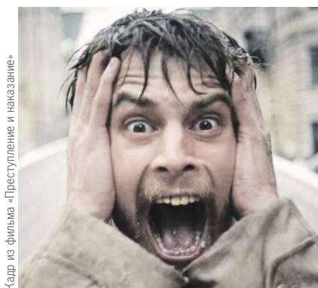
Кадр из фильма «Преступление и наказание»