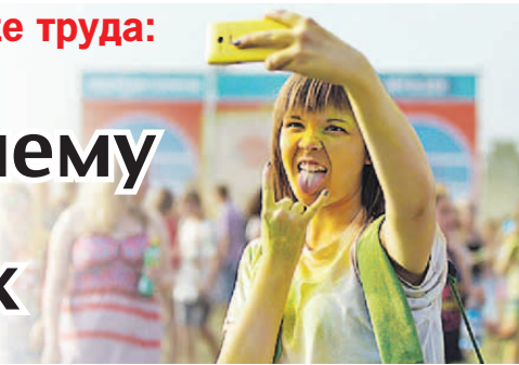
Мария ЛЕНЦ/«КП» - Красноярск