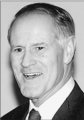
(Окончание на 4-й стр.)