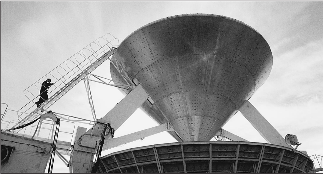
Одно из приемных устройств радиотелескопа РАТАН-600

Вначале не было ничего. Был вакуум. Из ничего появилось все. Это раньше думали, что вакуум — ничто. Теперь высчитали, что он обладает огромной энергией. Эта энергия так и прет из вакуума —