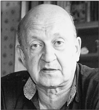
Академик Юрий Парийский

Астроном работает ночью, когда меньше шума. По станице Зелен-