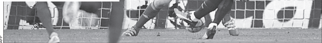
Вчера. Мюнхен. «Бавария» - «Атлетико» - 2:1. 54-я минута. Антуан ГРИЗМАНН сравнивает счет и лишает команду Пепа ГВАРДЬОЛЫ финала.

пирая стенку сбоку, нелепо растопырил ноги, и между ними, срикошетив, мяч пролетел в сетку. На какое-то время Хименес впал в ступор и через пару минут совсем зареялся, обняв за талию Хави Мартинеса, словно партнершу в танце, и попытался его покружить. Судья немедленно назначил пенальти. Хорошо еще, что во время исполнения 11-метрового перед Облаком опять внезапно не возник с медвежьими услугами бедолага Хименес, от которого в тот момент можно было ожидать чего угодно. Без его действительной помощи вратарь блестяще справился с ударом Мюллера.