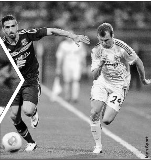
Июль 2013-го ДЕНИС ЧЕРЫШЕВ