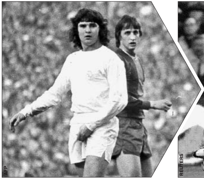
1970 - 1980-е Хосе Антонио КАМАЧО

В среду Денис Черышев впервые в жизни отыграл 90 минут за основной состав «Реала». А вчера единственный в истории российский легионер мадридцев подписал с первой командой «Королевского клуба» контракт до 2017 года!