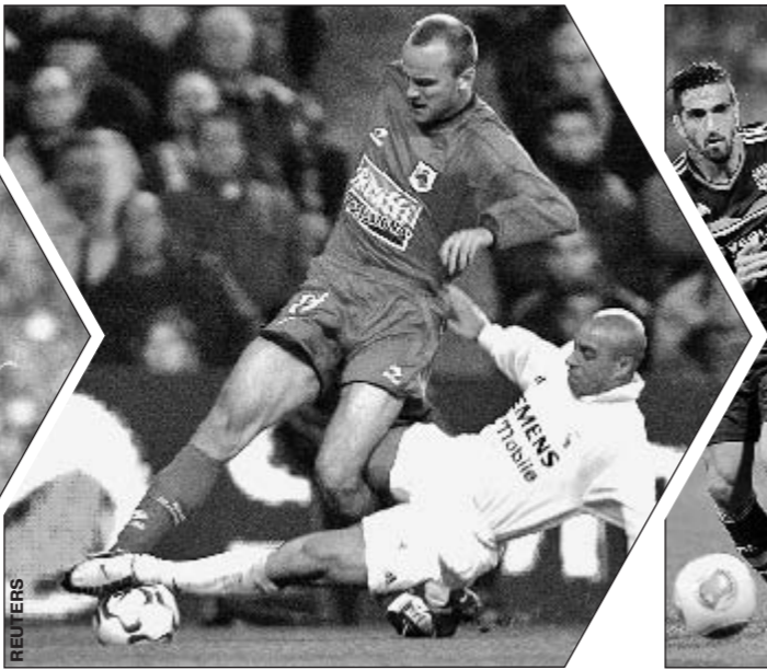
1990 - 2000-е РОБЕРТО КАРЛОС