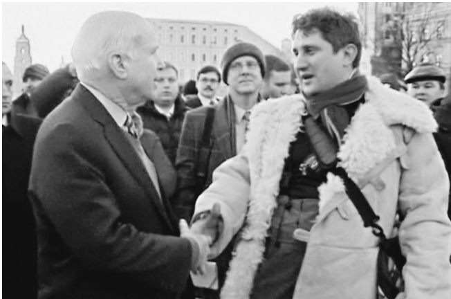
Встреча с американским сенатором Маккейном в Киеве произвела на финансиста неизгладимое впечатление