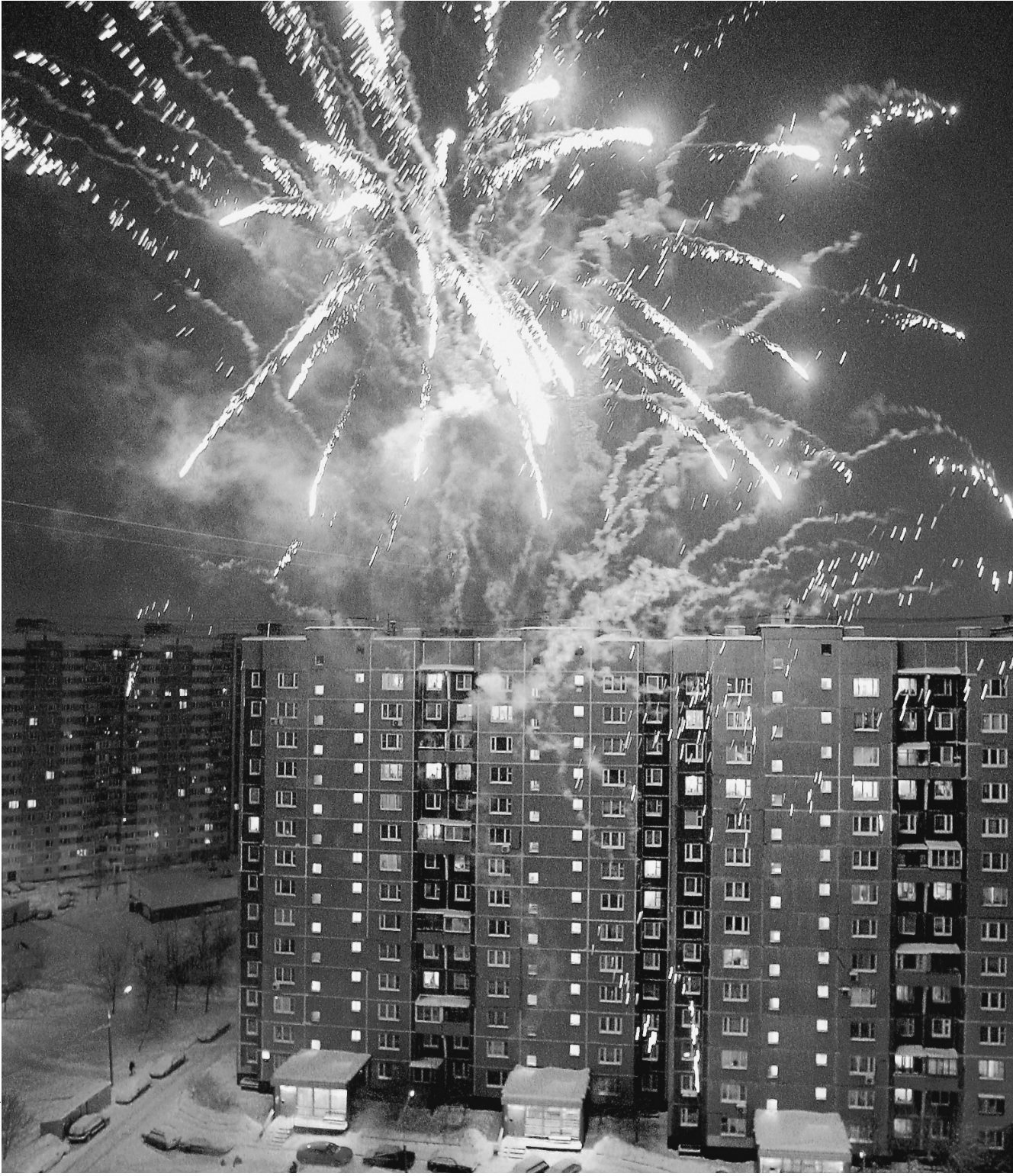
Валютные колебания практически не повлияли на предпочтения жителей столицы, пострадать может только пиротехника