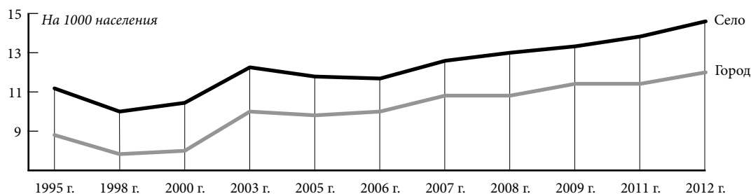
Рис. 1. Динамика рождаемости городского и сельского населения Приморского края в 1995–2012 гг.

службы государственной статистики, ее территориального управления и Приморского краевого информационно-аналитического центра показывает, что она в основном копировала общероссийский тренд, проявлением которого за два последних десятилетия стал волнообразный характер кривых, характеризующих естественное движение населения. С 1989 по 1999 г. значения общего коэффициента рождаемости снизились в 1,93 раза – с 15,5 до 8 на 1000 родившихся. С 2000 г. начался его рост, что во многом было обусловлено выходом из очередного демографического провала и увеличением числа женщин репродуктивного возраста. После 2006 г. на динамику общего коэффициента рождаемости позитивно влияла реализация политики государства, направленная на стимулирование рождаемости в рамках программы материнского капитала и социальной поддержки семей, имеющих детей [11]. Это позволило достичь значений общего коэффициента рождаемости в Приморском крае в 2012 г. – 12,6 на 1000 населения. Однако за последние 13 лет так и не удалось превысить уровень рождаемости дореформенного периода, что свидетельствует о глубине процессов деструкции воспроизводства населения. Значения общего коэффициента рождаемости в Приморском крае на протяжении двух последних десятилетий были стабильно ниже, чем в ДВФО. При сравнении с данными по стране в целом они чередовались по годам, но в течение последних пяти лет были ниже (табл. 1).