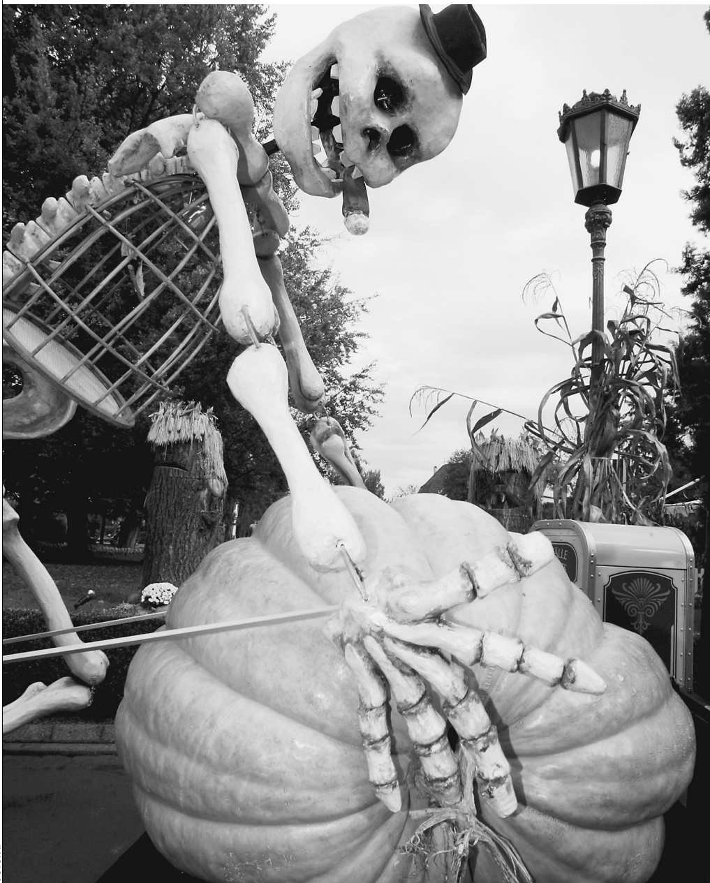
«Нечистый» праздник в России приживается с трудом

Московским детям уже третий год подряд запрещено праздновать Хеллоуин — официальным письмом департамента образования Москвы праздник «заграничной» нечисти «не рекомендован» к проведению в столичных школах. Чиновники от педагогики уверяют, что любимый праздник американских (а в последние годы и европейских) школьников «разрушителен для психического и духовно-нравственного здоровья учащихся». Зато родители духовно здоровых детей в вечер всех святых гуляют напраполю — вечеринка на Хеллоуин в ночных клубах стоит до 1000 долларов.