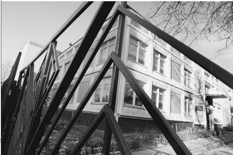
Родители давно знают: случай в этом детском саду — вовсе не исключение из правил

общение об этом пресс-служба московского УБЭПа распространила только в понедельник. Как рассказал «Известиям» представитель столичного