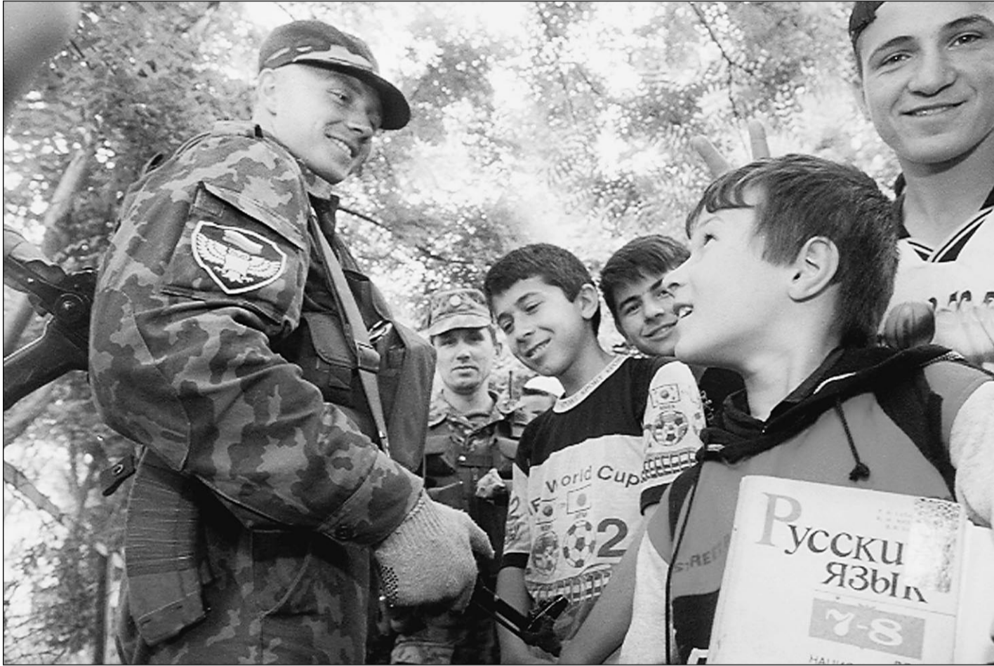
Теперь в Чечне появятся и гражданские учителя