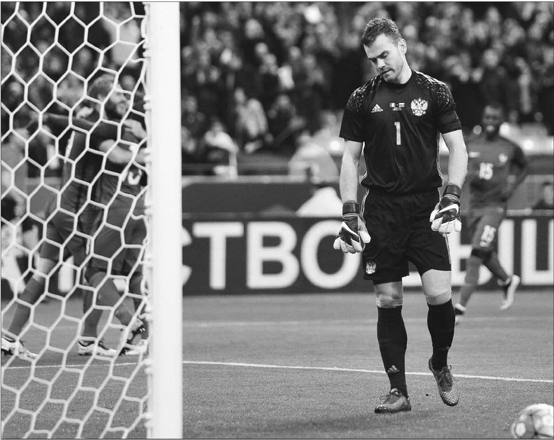
Вчера. Сен-Дени. Франция - Россия - 4:2. 8-я минута. Эмоции Игоря АКИНФЕЕВА после первого гола французской сборной.