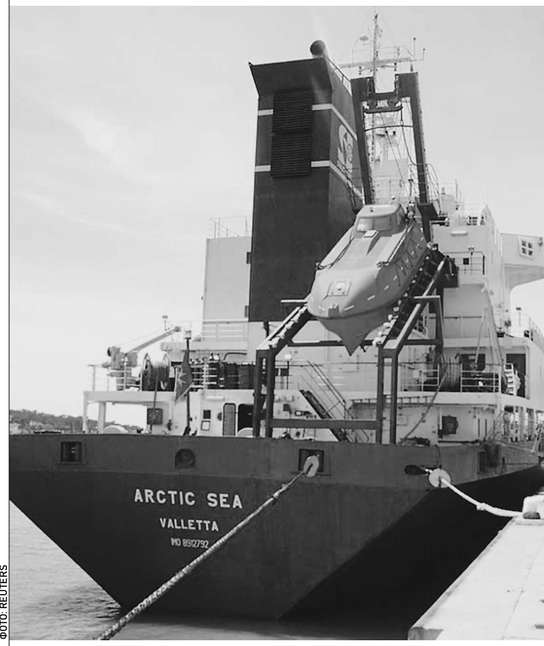
Вокруг этого сухогруза циркулирует огромное количество слухов

наша Светлана Кузнецова, если бы накануне не проиграла датчанке Каролин Возняцки. Не исключено, что в лице Мелани Удин мы наблюдаем восхождение будущей звезды. Но, она далеко не первый вундеркинд в истории тенниса. «Известия» изучили биографии других одаренных игроков, которые тоже подавали большие надежды, и выяснили, какие опасности их подстерегают. → стр. 11