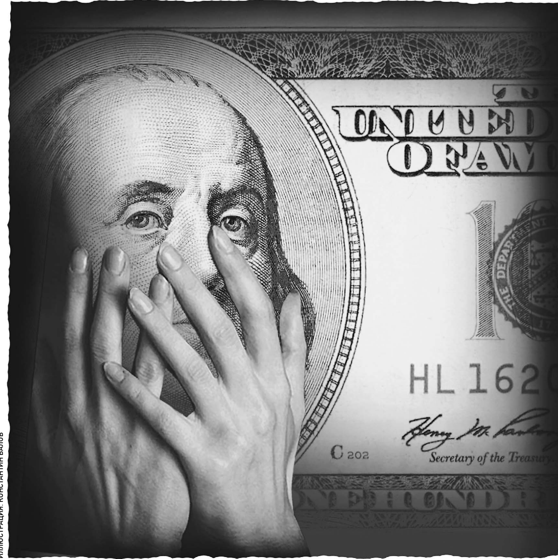
ИЛЛЮСТРАЦИЯ КОНСТАНТИН ВАЛОВ

Тучи над долларом стущаются. К хору многочисленных сторонников лишения его статуса мировой резервной валюты присоединилась ООН. Это прецедент: впервые за пересмотр всей мировой денежной политики высказалась международная организация с таким весом. По итогам своей женеvской конференции по торговле и развитию и накануне саммита «большой двадцатки» в Питтсбурге ООН опубликовала революционный доклад, в котором вслед за Россией и Китаем предложила создать новую валюту. Эксперты организации уверены, что перемены назрели, так как многие страны стали заложниками финансовых спекуляций американских властей и бизнеса. Все это, безусловно, логично. Но есть ли реальный шанс у новой валюты?