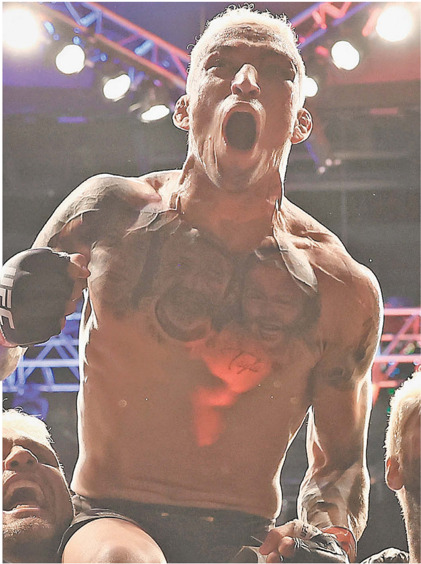
7 мая. Финикс. Эмоции Чарльза Оливейры после победы над Джастином Гэтжи