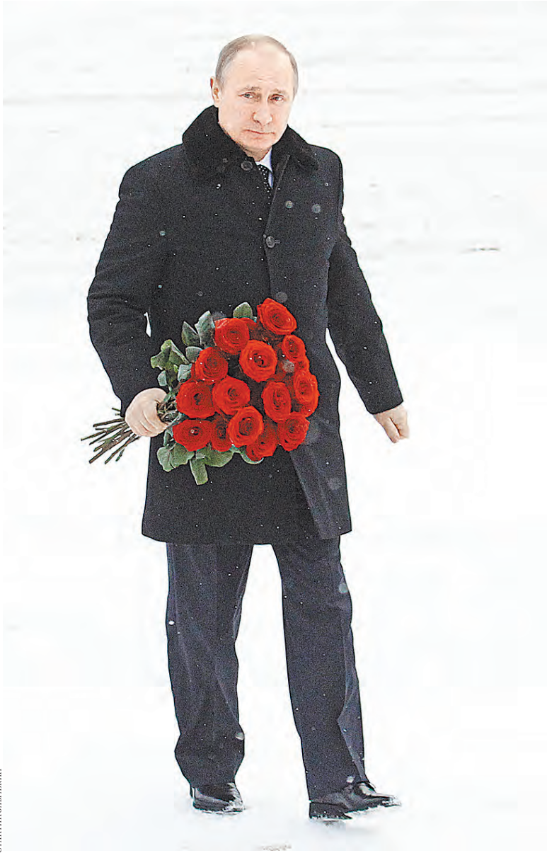
Президент возложил букет торжественных красных роз к памятнику «Рубежный камень» на левом берегу Невы, где погибли 200 тысяч воинов. Здесь воевал и отец Путина—Владимир Спиридонович.

Вечером Путин вместе с блокадниками смотрел спектакль «Реквием», посвященный 70-летию освобождения Ленинграда. Начался спектакль с минуты молчания.