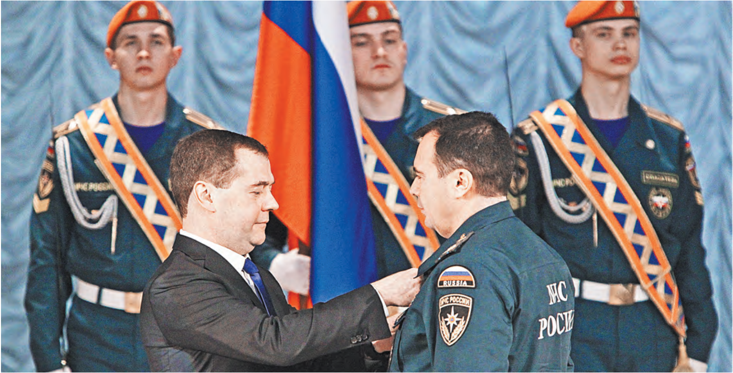
Дмитрий Медведев во вторник вручил государственные награды сотрудникам МЧС: ордена и медали. «Ваша самоотверженная работа и высокий профессиональный уровень позволяет сохранить самое ценное — человеческие жизни», — отметил премьер.

ГЛАВА минобрнауки Дмитрий Ливанов заявил, что за 3 года зарплата учителей выросла более чем на 12 тыс. рублей и сегодня превышает 28 тыс. рублей. «В начале реализации программы в 2011 году зарплаты педагогов общего образования составляли 15,9 тыс. рублей, или 70% от средней зарплаты по стране. Сегодня зарплата учителей превышает 28 тыс. рублей, или 95% от средней по стране», — заявил он, добавив, что прирост зарплат составил 76%.