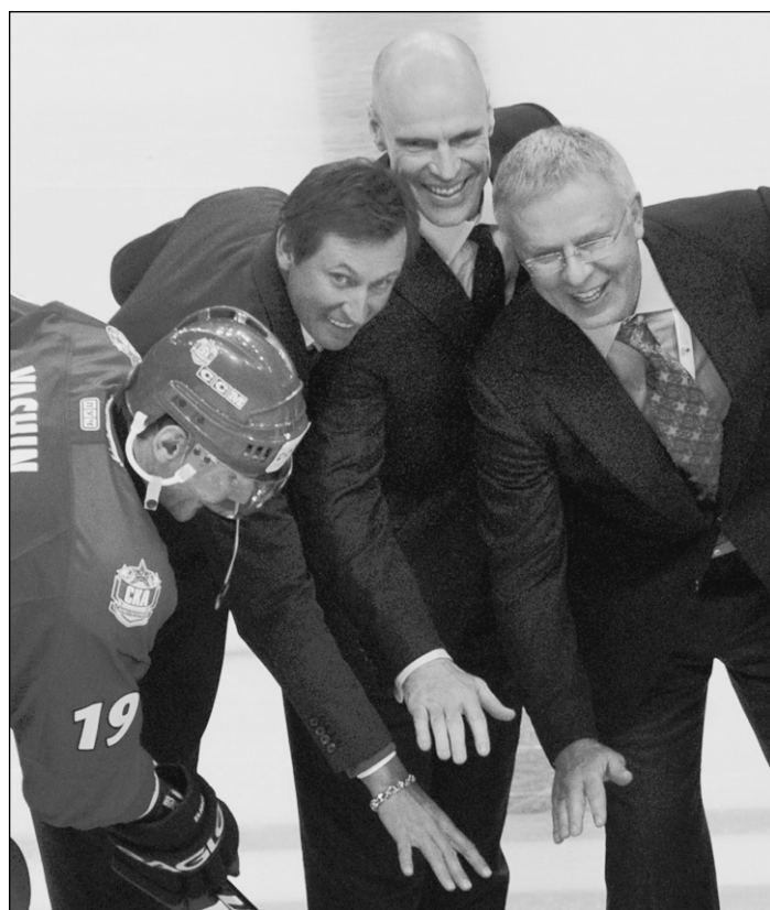
Суббота. Минск. Алексей ЯШИН, Уэйн ГРЕТЦКИ, Марк МЕССЬЕ и Вячеслав ФЕТИСОВ (слева направо) на символическом вбрасывании.

В субботу в Минске состоялся второй в истории КХЛ Матч звезд, одним из главных событий которого стал приезд легендарного канадского хоккеиста