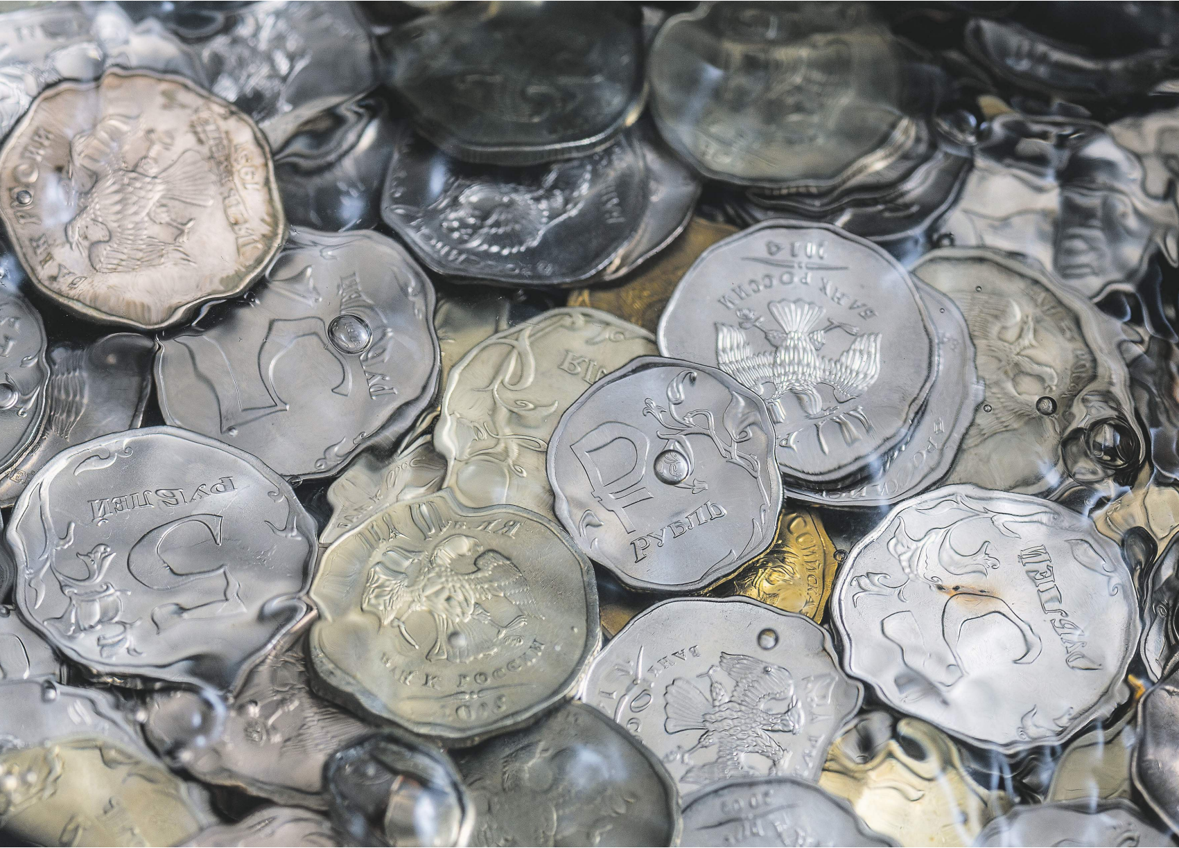
Евгений Рауничай / Ведомости / ТАСС