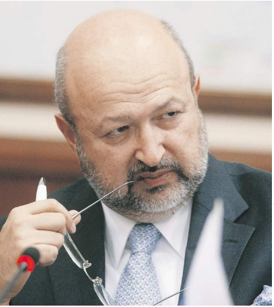
Святослав Краснов / ТАСС

Действительно, визит был насыщенным. Татарстан мне показался