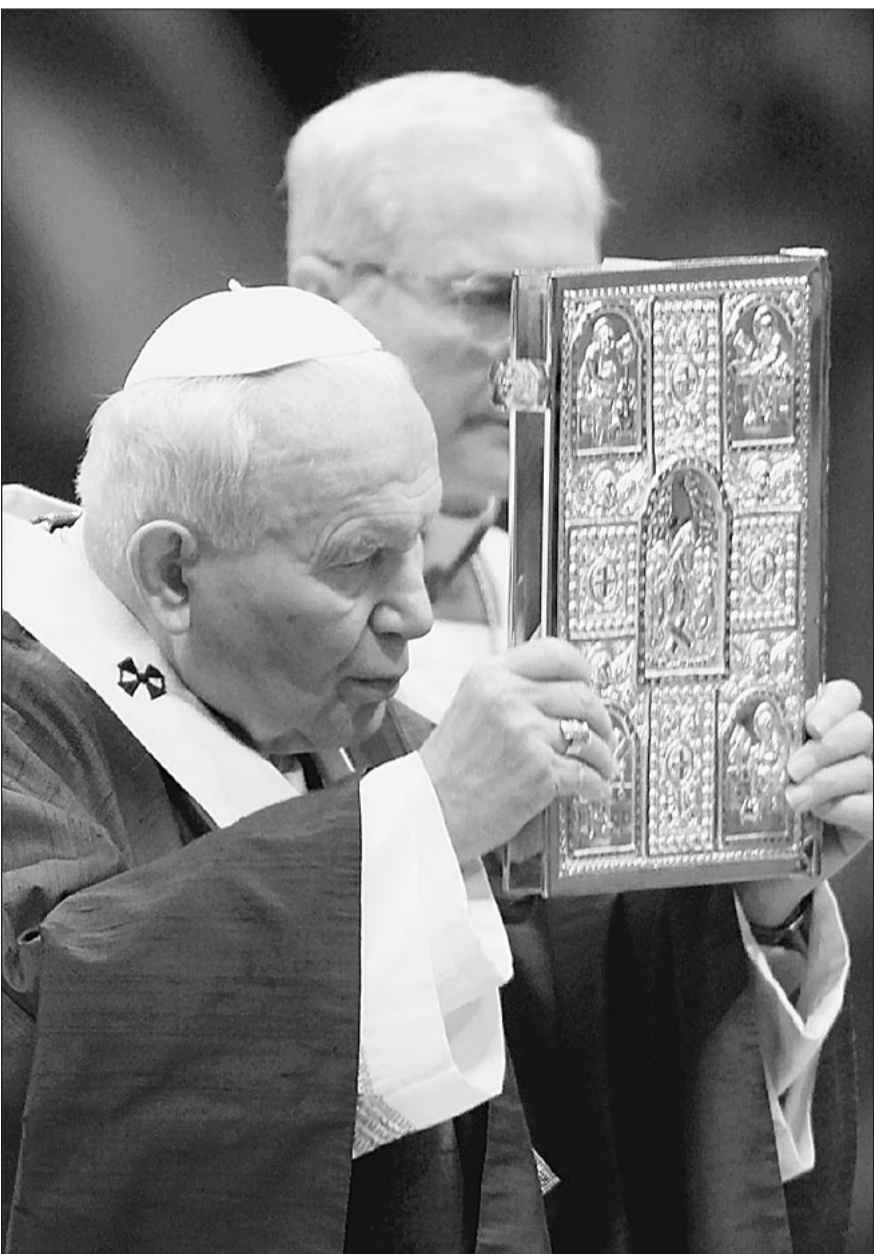
У двух главных христианских церквей все-таки есть общие святыни