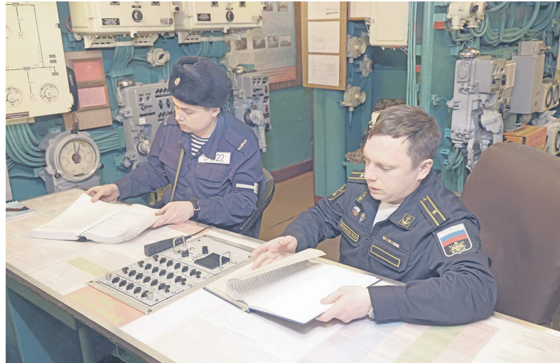
Работа с военнослужащими на боевом посту.

Боевой дух, взаимопонимание в коллективе, уверенность в товарищах – всё это составляющие успеха в любом, даже самом сложном морском походе. Вдали от дома, в замкнутом пространстве корабельных помещений, когда каждый день сопряжён с риском и ответственностью, именно моральная устойчивость моряков становится решающим фактором успешного выполнения поставленных задач. Ведь в море не берут непрофессионалов.