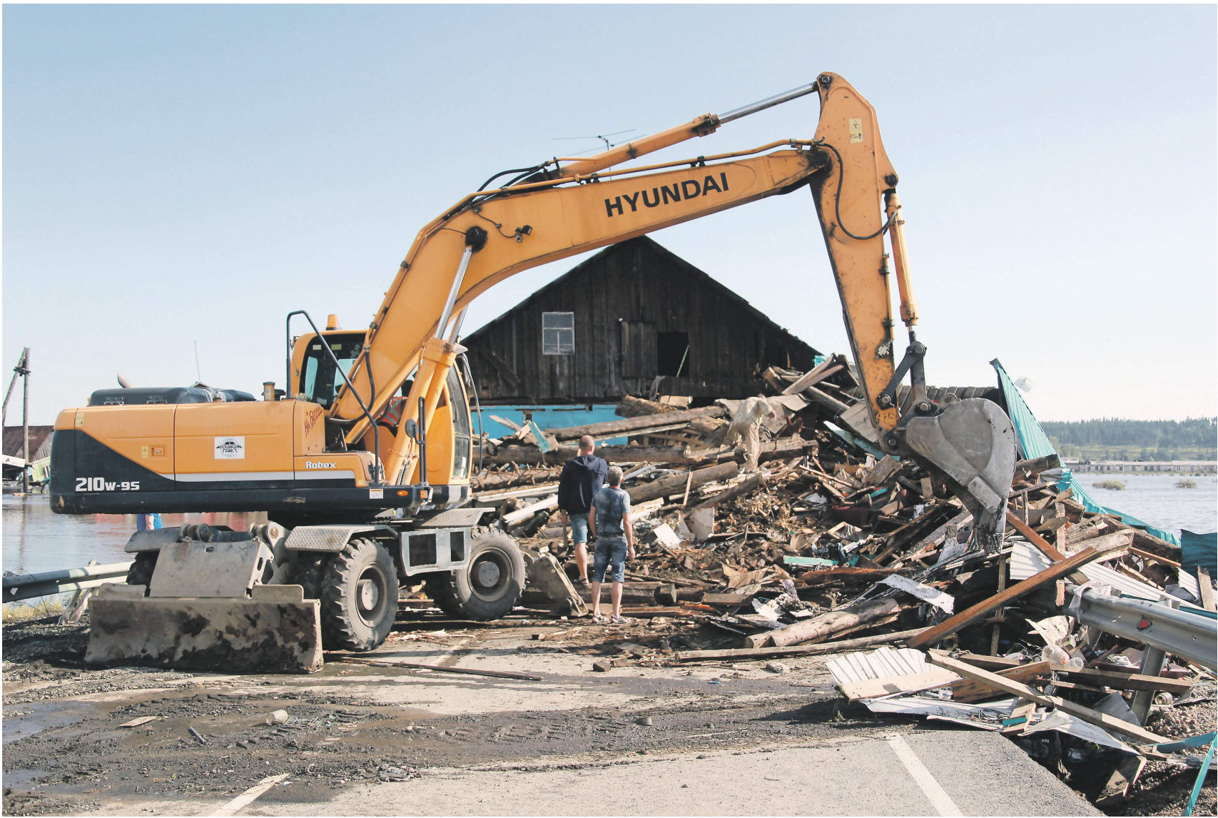
Собранные средства будут направлены на ликвидацию последствий стихийных бедствий (на фото — разбор завалов на трассе Р255 в районе разлива реки Ия в Тулуе, Иркутская область)