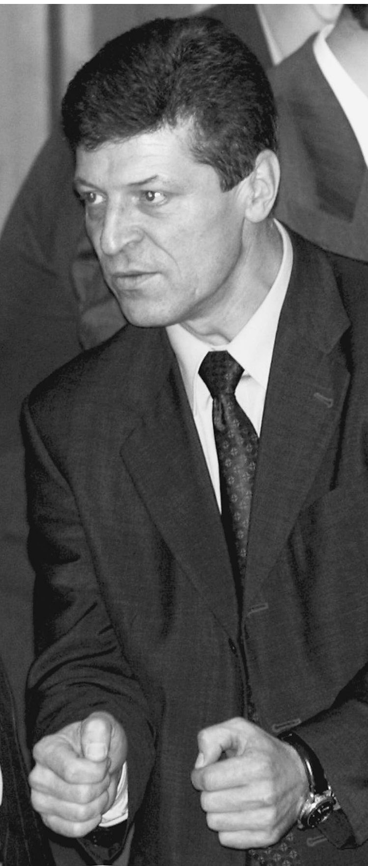
Дмитрий Козак хочет научить регионы жить на заработанное