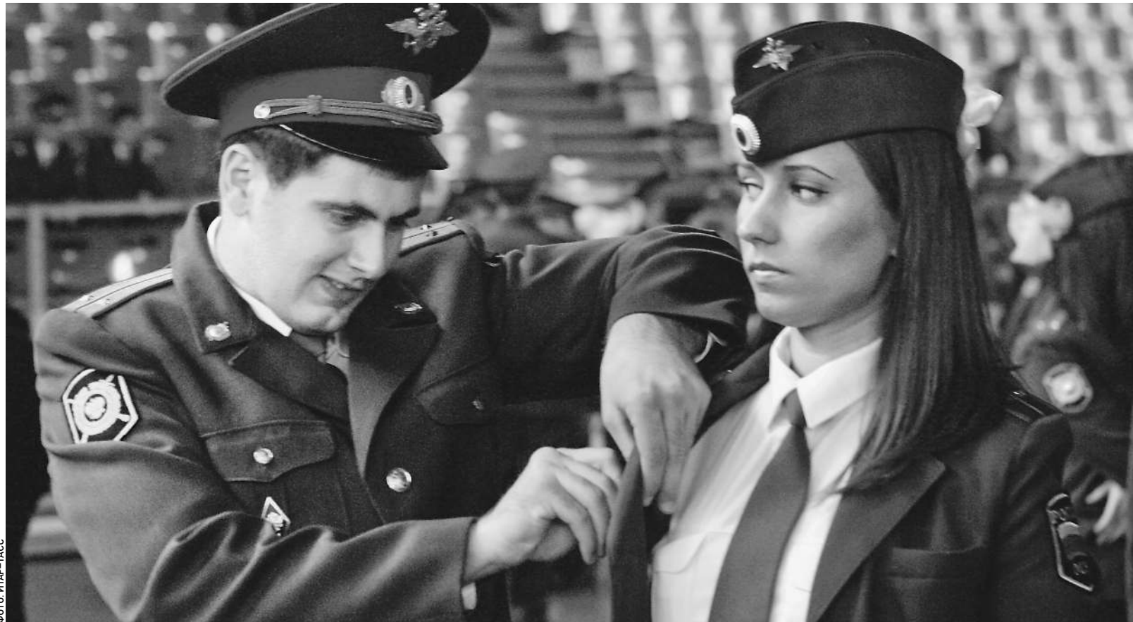
В случае с полицией форма и содержание хотя и идут рядом, но второе — важнее

И уже запросило эти деньги у правительства