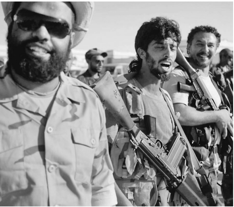
Недавно повстанцы называли себя «шаббаб» (пацаны). Сейчас они — бойцы вооруженных сил Ливии