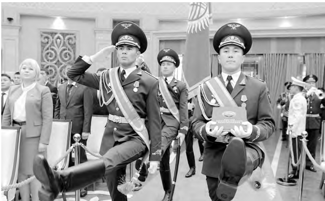
ПРЕСС-СЛУЖБА ПРЕЗИДЕНТА КР