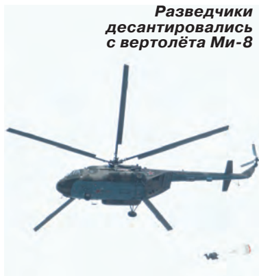
Разведчики десантировались с вертолёта Ми-8

Хорошо натренированный экипаж выполняет все эти манёвры за считанные секунды и оказывается практически неуязвимым для противника: тот просто не успевает среагировать на неожиданный удар.