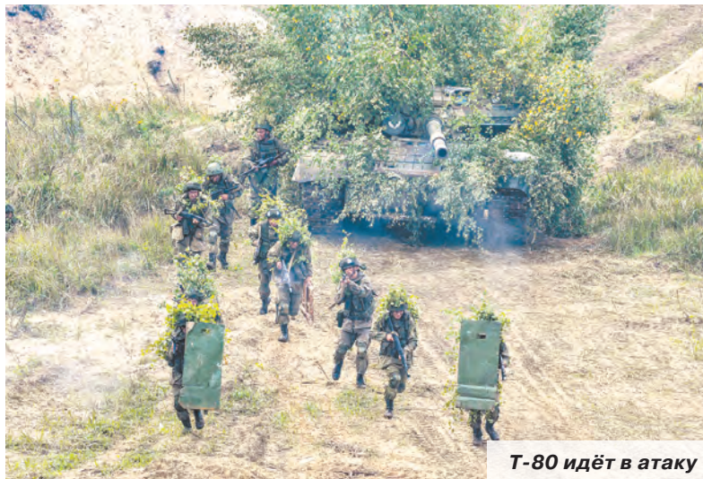
Т-80 идёт в атаку