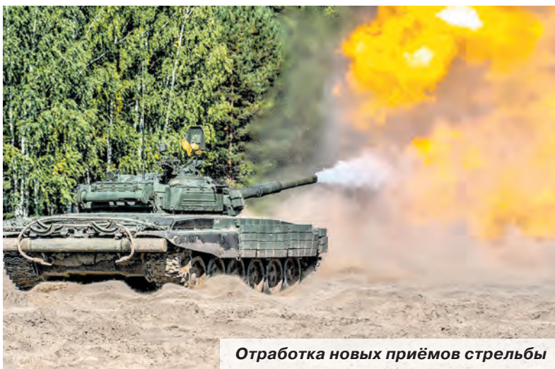
Отработка новых приёмов стрельбы

Для гарантированной победы над условными врагами экипажи танков Т-72Б3 и Т-80 использовали так называемые «карусель» и «качели». Смысл «карусели» заключается в том, что танковое подразделение ведёт в движении непрерывный фланговый обстрел неприятеля. Как правило, это происходит под прикрытием искусственных сооружений, например насыпного вала, или складок местности – скажем, неглубокого оврага. При этом боевые машины в определённый момент стремительно выдвигаются на рубеж открытия огня и так же быстро покидают его после выстрела. На смену им тут же приходят другие танки. Этот манёвр называется «качели». Он обычно деморализует противника, поскольку тот постоянно находится под огнём воздействием и не может точно знать, откуда в следующую минуту последует удар.