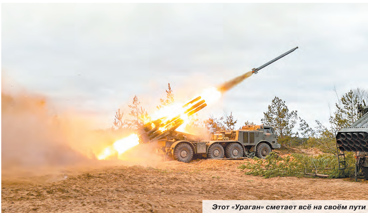
Этот «Ураган» сметаёт всё на своём пути