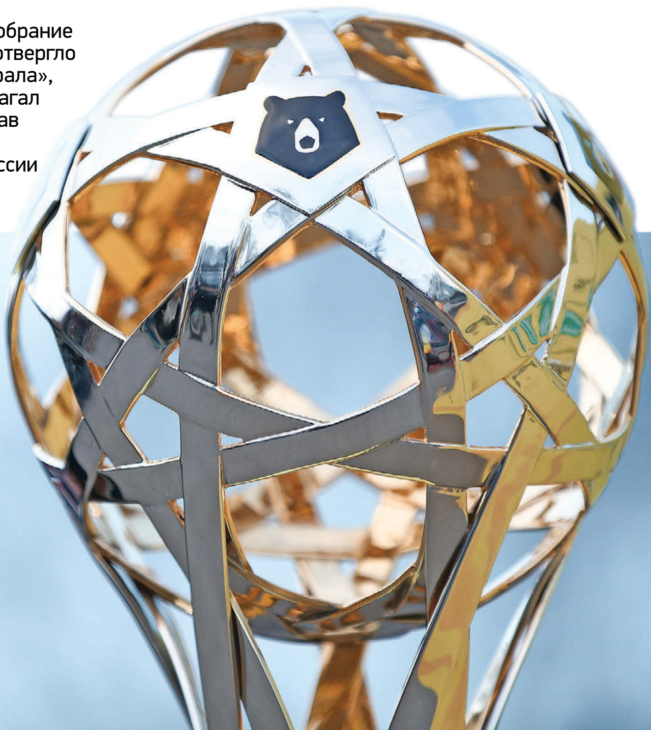
Дарья Исаева «СЭ»

Вчера общее собрание премьер-лиги отвергло инициативу «Урала», который предлагал увеличить состав участников чемпионата России до 18 клубов