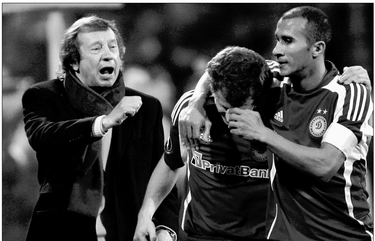
Четверг. Киев. «Динамо» К - «ПСЖ» - 3:0.

Вчера интервью «СЭ» дал главный тренер киевского «Динамо», которое поздним вечером в четверг вышло в полуфинал Кубка УЕФА