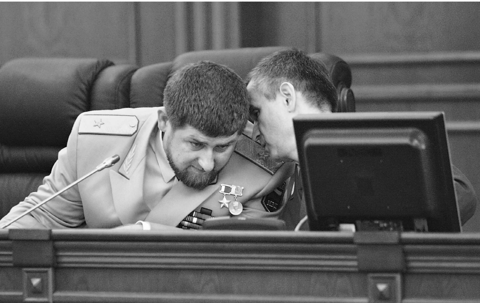
Рамзан Кадыров и Рашид Нургалиев озабочены активизацией боевиков на Северном Кавказе

Трое боевиков ворвались в здание парламента республики и устроили там перестрелку