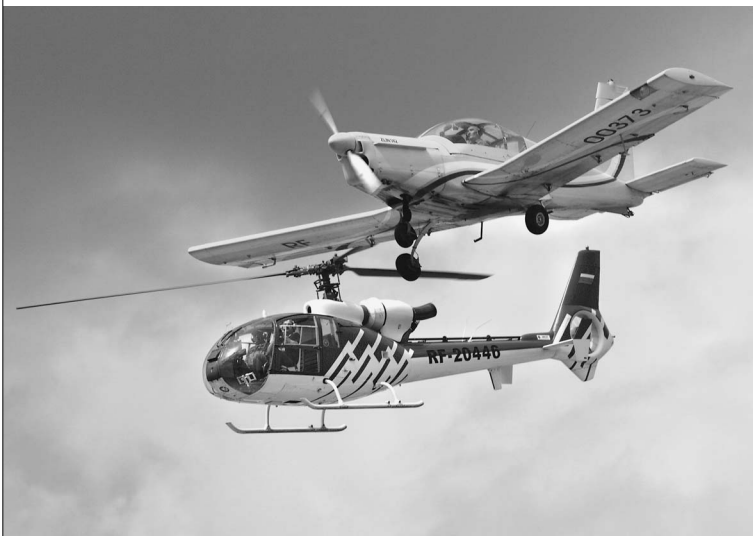
Небо России теперь заполнила западная авиатехника