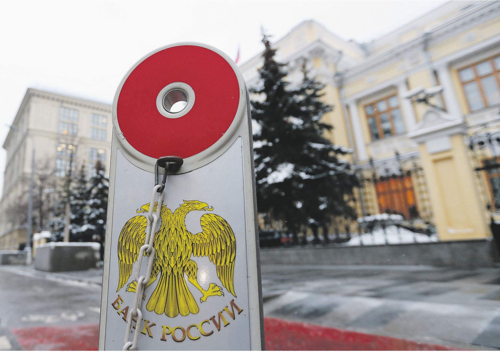
Ставки на кредиты для малого бизнеса тесно связаны с политикой Центробанка