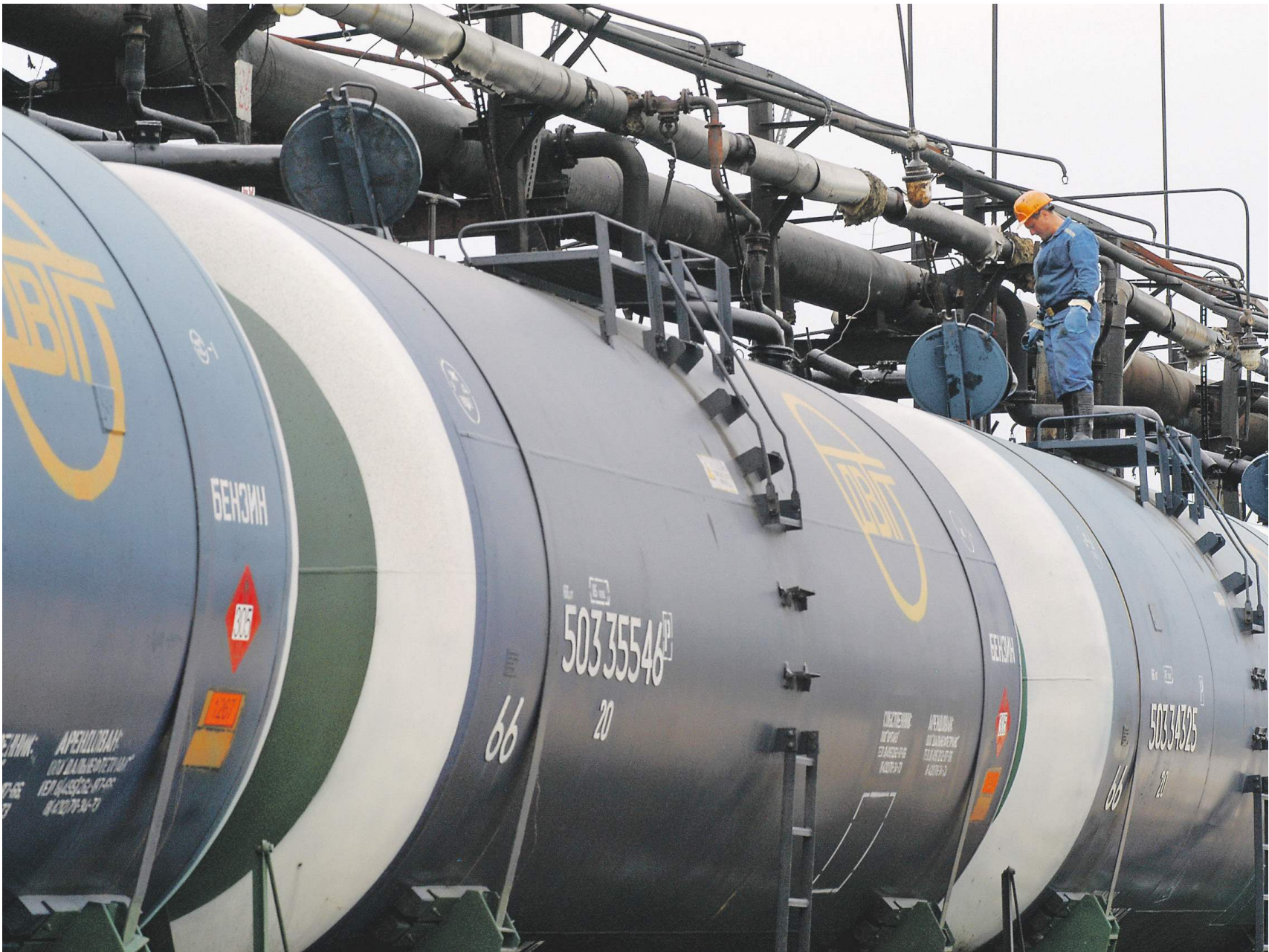
Средий Петер / Известия / ТАСС