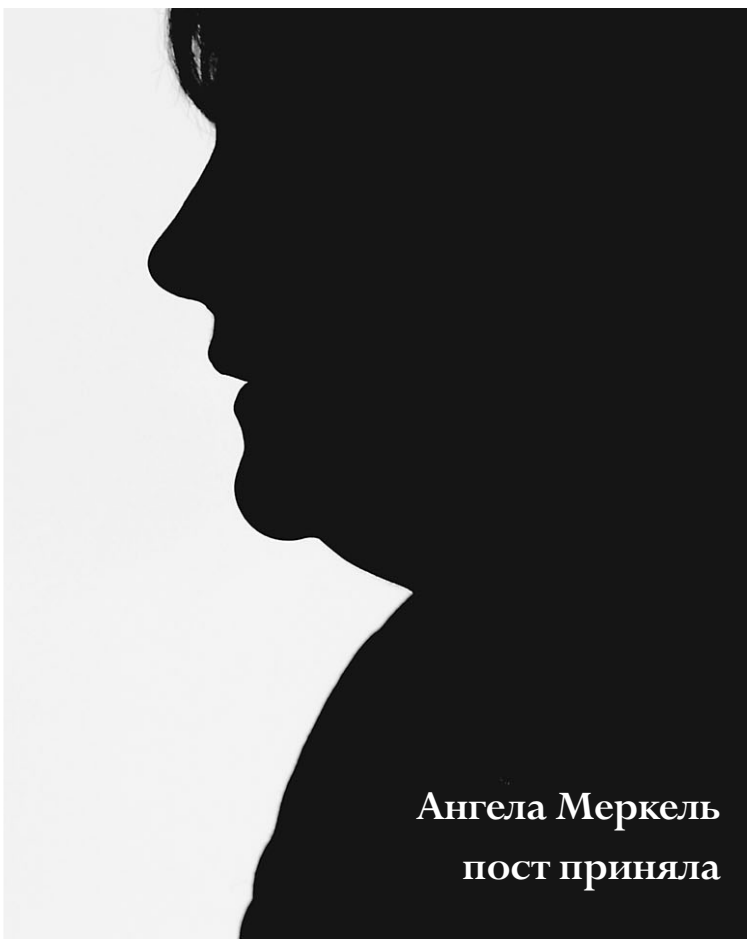
Ангела Меркель пост приняла

В Германии наконец-то завершился «вакуум власти», возникший после парламентских выборов 18 сентября. Выборы эти так и не выявили победителя. Правые (блок ХДС/ХСС) и левые (социал-демократы) финишировали с минимальным отрывом друг от друга. А затем в течение трех последних недель ожесточенно делили власть. И вот вчера, кажется, поделили.