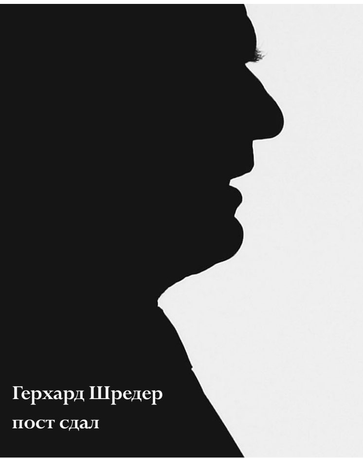
Герхард Шредер пост сдал