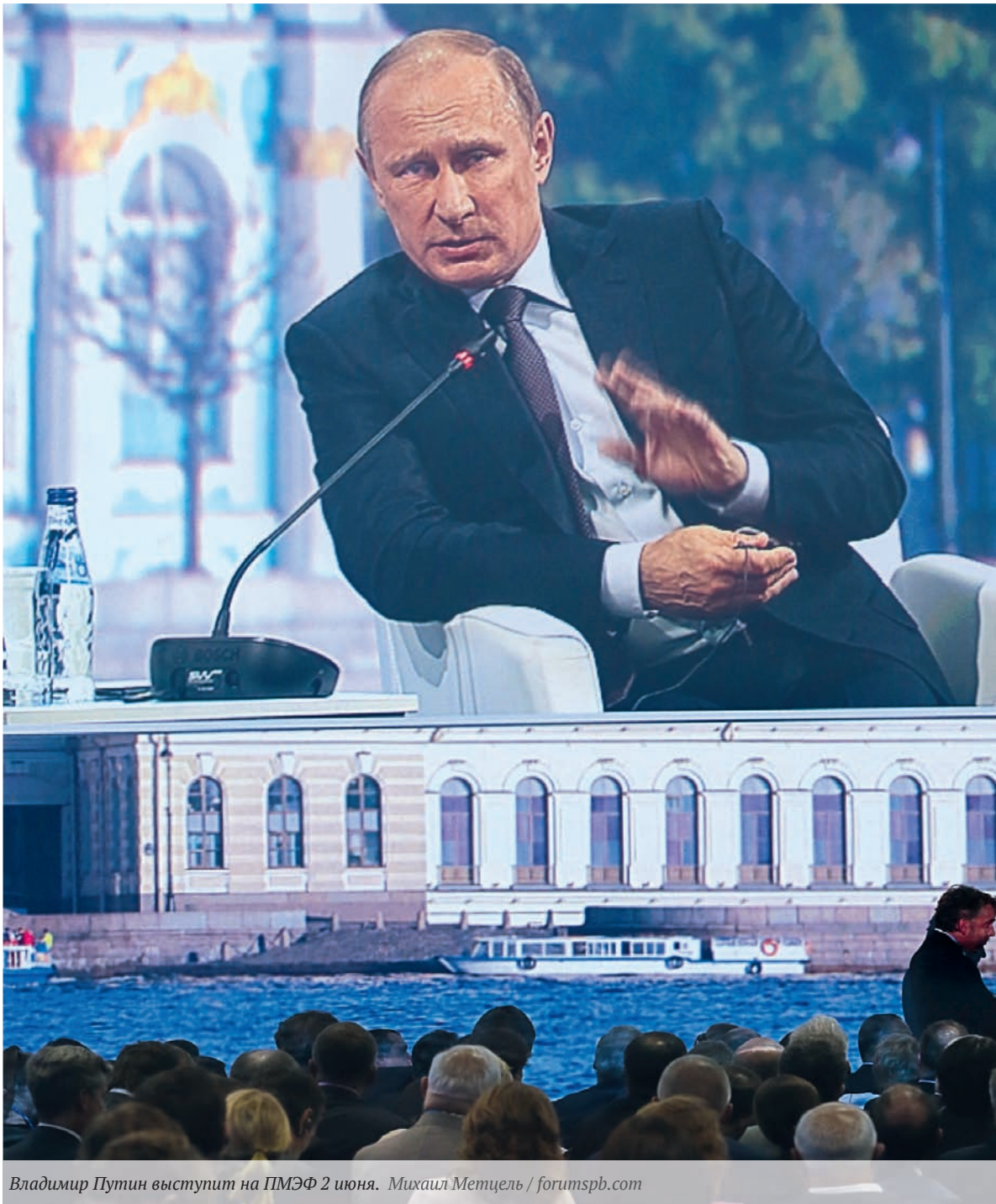
Владимир Путин выступит на ПМЭФ 2 июня.

По результатам ежегодного исследования ВЦИОМ почти каждый второй россиянин останется этим летом дома. Основная причина – проблемы с деньгами. За границу планируют поехать 6% опрошенных, а 17% намерены провести лето вообще без отпуска. В Ассоциации туроператоров России (АТОР) считают прогнозы ВЦИОМ по выезду сограждан за рубеж «очень оптимистичными».