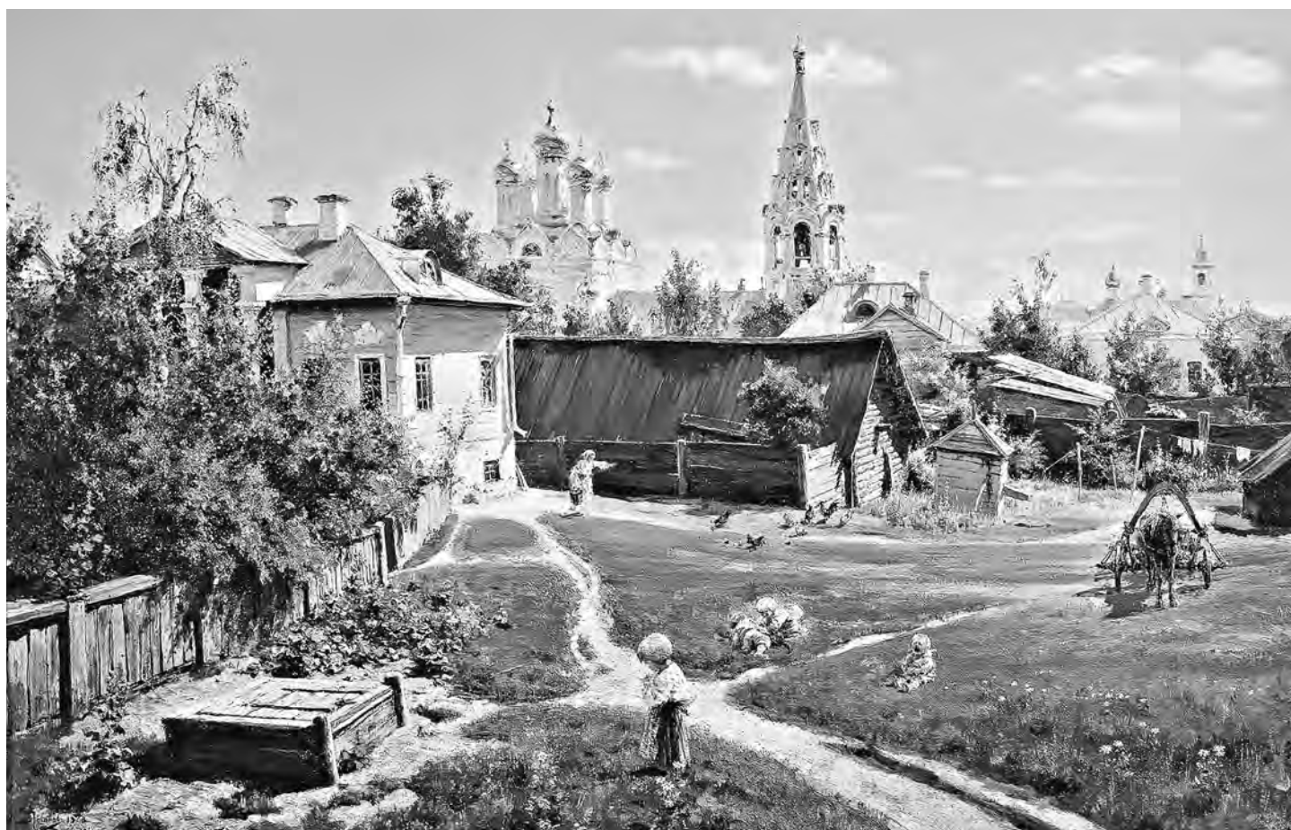
В XXI веке поленовский дворик не избежал бы «точечной застройки».