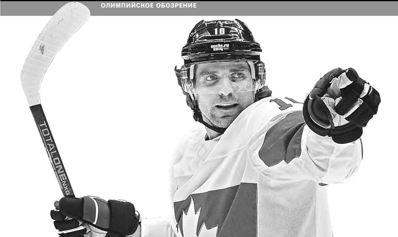
Сборная Канады, несмотря на невыразительную игру, является фаворитом мужского хоккейного турнира.

Официальные курсы валют ЦБ России с 21.02.14