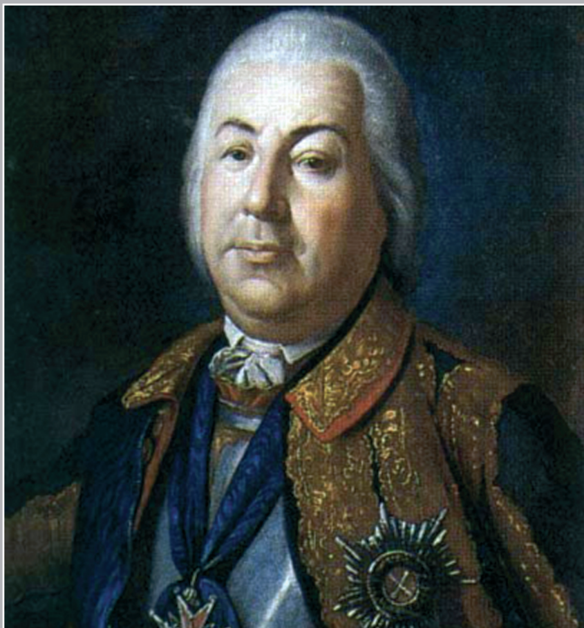
ПЕТР СЕМЕНОВИЧ САЛТЫКОВ