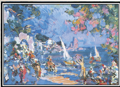
К. Коровин Невольничий базар на Востоке 1912 г.