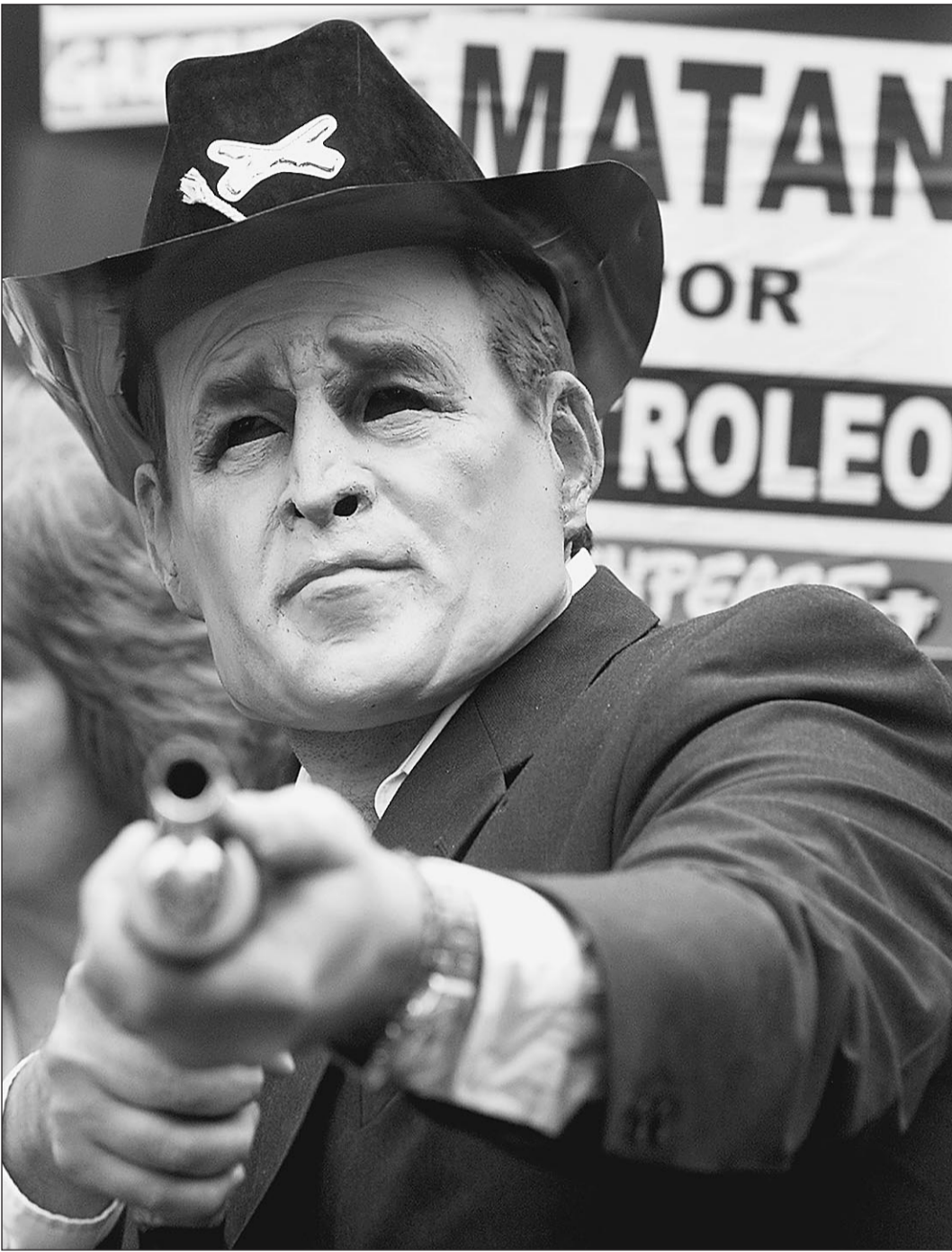
На демонстрации в Буэнос-Айресе. С Джорджа Буша снимают все и всяческие маски

Но нет. Американцы, будто помутнение на них нашло, повели себя прямо как европейцы и решили заручиться легитимной поддержкой международного сообщества. Говаривали им Рамсфелд: «Если ты пытаешься угодить всем, обязатель-