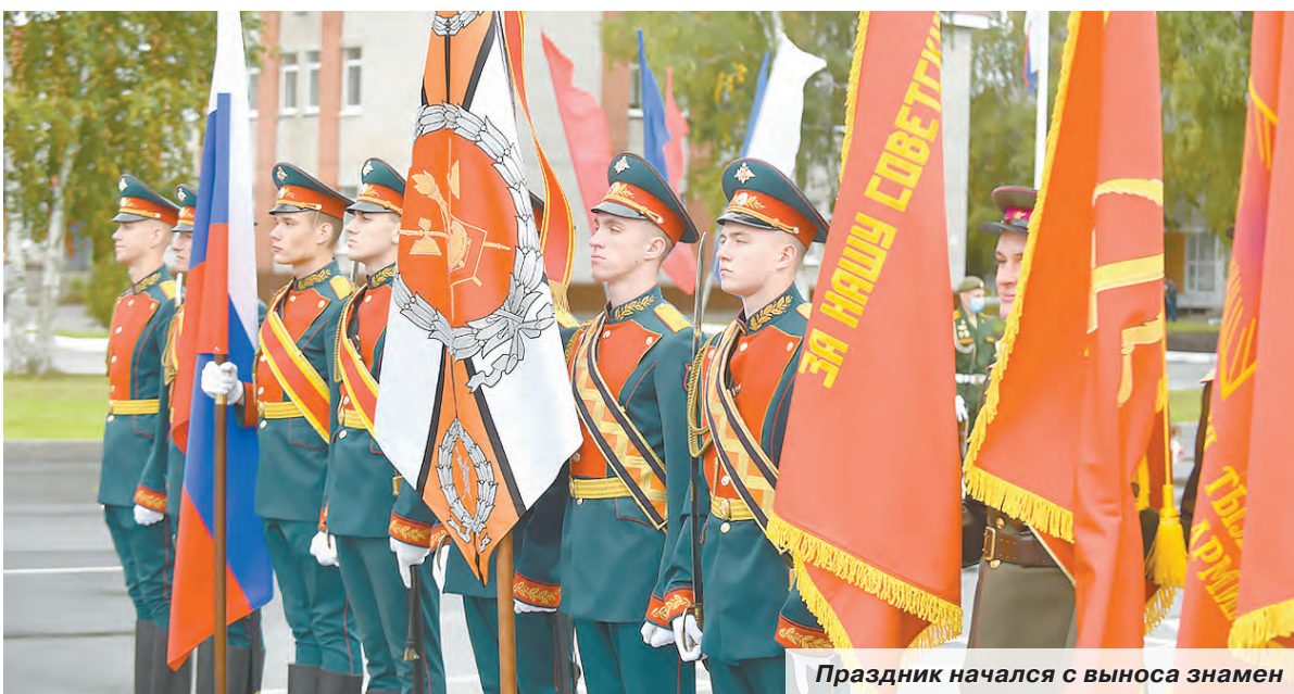
Праздник начался с выноса знамен

– Служить в нашей армии – дело чести. Но воинская служба – это не только почётное дело. Она включает в себя и упорный труд, и личную ответственность, а порой и огромный риск, – сказал в приветственном слове он. – Учитесь по-настоящему, честно, ни при каких обстоятельствах не падайте духом, не останавливайтесь ни перед какими препятствиями. И будьте уверены: ваши знания, энергия и целеустремлённость будут востребованы в войсках.