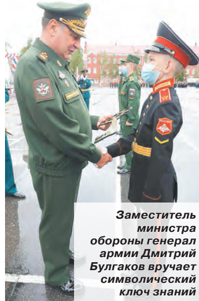
Заместитель министра обороны генерал армии Дмитрий Булгаков вручает символический ключ знаний

Замминистра обороны открыл новый учебный год в военном вузе Петербурга. Генерал армии Дмитрий Булгаков посетил Военный институт Железнодорожных войск и военных сообщений Военной академии материально-технического обеспечения имени генерала армии А.В. Хрулёва. Здесь он принял участие в торжественных мероприятиях, посвящённых Дню знаний.