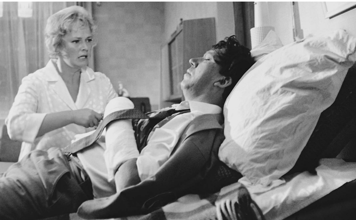
«Известия» ждут в гости легендарную Нину Гребешкову

7 декабря в Медиа-центре «Известий» соберется Арт-клуб — чтобы обсудить очень важную проблему: куда делись качественные российские кинокомедии? Над чем вынужден смеяться современный зритель, почему прерваны традиции и среди молодых режиссеров не появляются новые Гайдан, Данелин, Рязановы? В 2009 году отечественный кинематограф произвел на свет почти три десятка комедий, но многие ли из них стали событиями?.. Этот невеселый разговор согласились поддержать легенды и мастера жанра: Нина Гребешкова, Алла Сурикова, Наталья Селезнева, Владимир Меньшов, Сергей Безруков, Анатолий Максимов. Мы приглашаем читателей «Известий» принять участие в Арт-клубе. Присылайте вопросы нашим гостям по электронному адресу tsareteli@izvestia.ru . Народные комедии — народное дело!