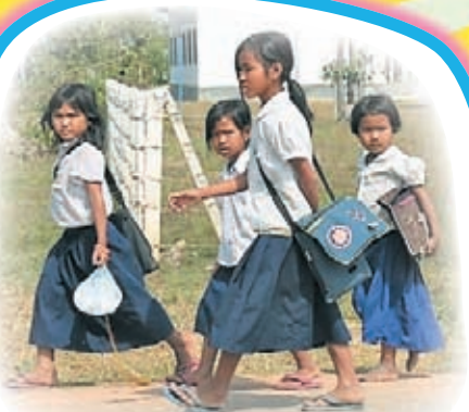
ШКОЛЫ в разных странах