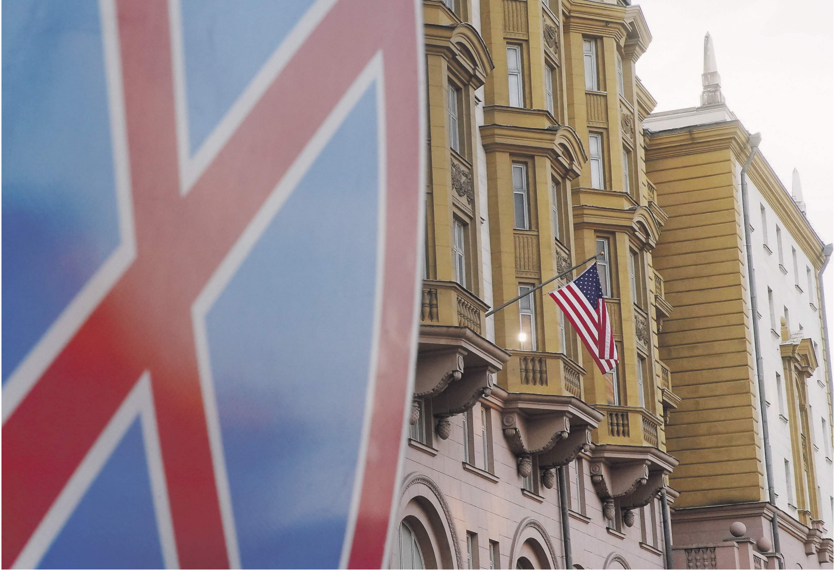
Защита Карпенко