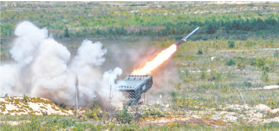
ТОС «Солнцепёк» в действии на полигоне в Брестской области

в том числе управление начальника войск РХБ защиты ВС РФ проводило учения в два этапа. Первое учение состоялось на Курской АЭС, отрабатывали ликвидацию последствий радиационной аварии, второе – прошло на полигонах Мулино и Луга. Здесь отрабатывали задачи, которые выполняются как при подготовке операции, так и в ходе её проведения. Само по себе ССУ «Запад-2021» было интересным – длительный период развития событий, на этапах которого войска выполняли задачи в ходе самостоятельных тактико-специальных учений (ротных, батальонных), и по-