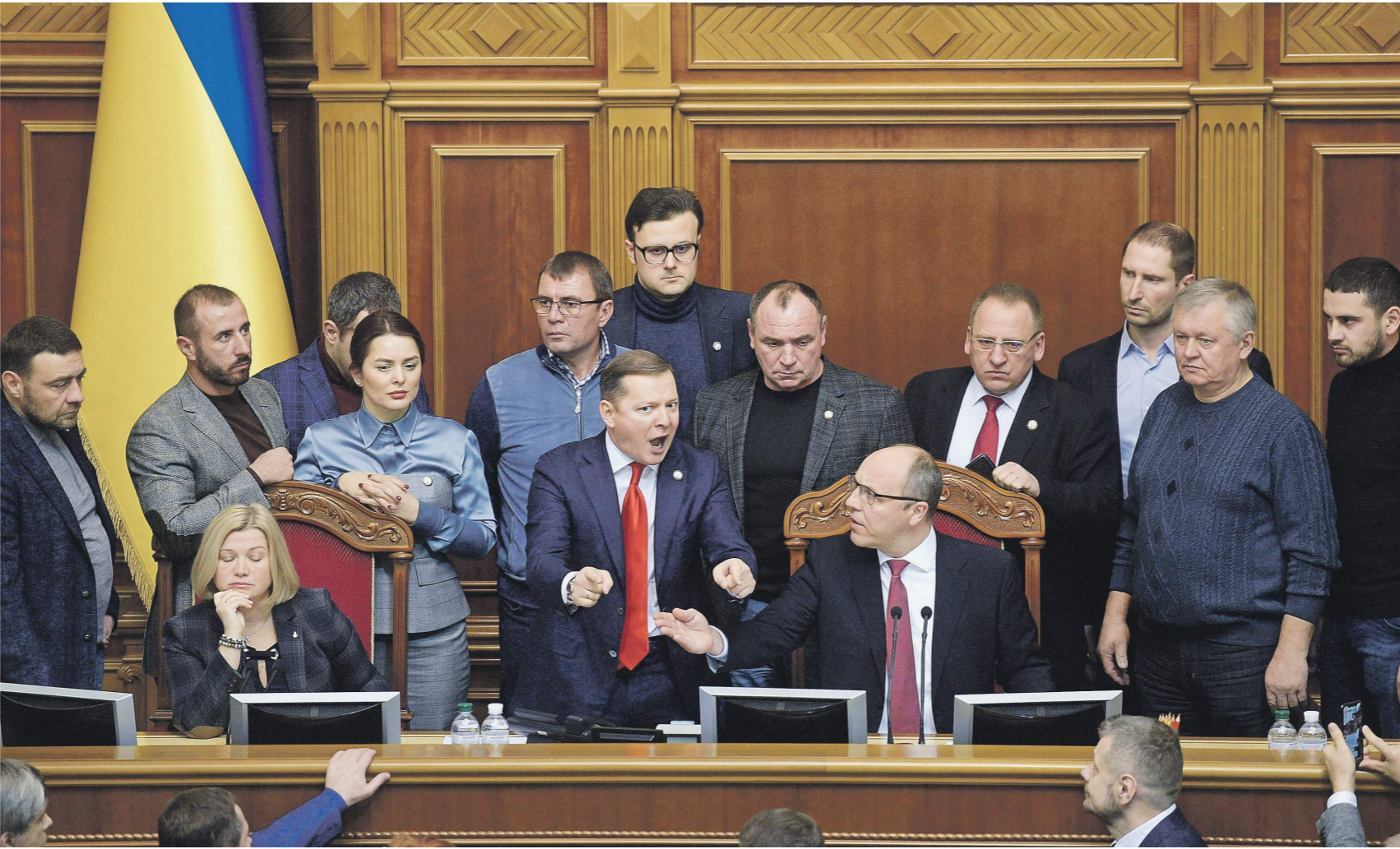
Решение Верховной рады может помешать проведению выборов и обострить ситуацию в Донбассе