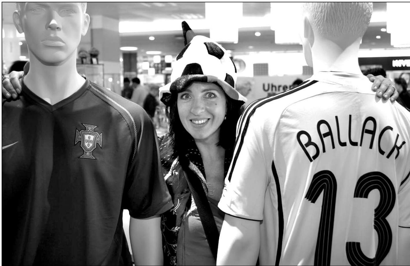
Вчера. Висбаден. Городской супермаркет. Чем ближе чемпионат мира, тем больше популярность футболка Михаэля Баллака.