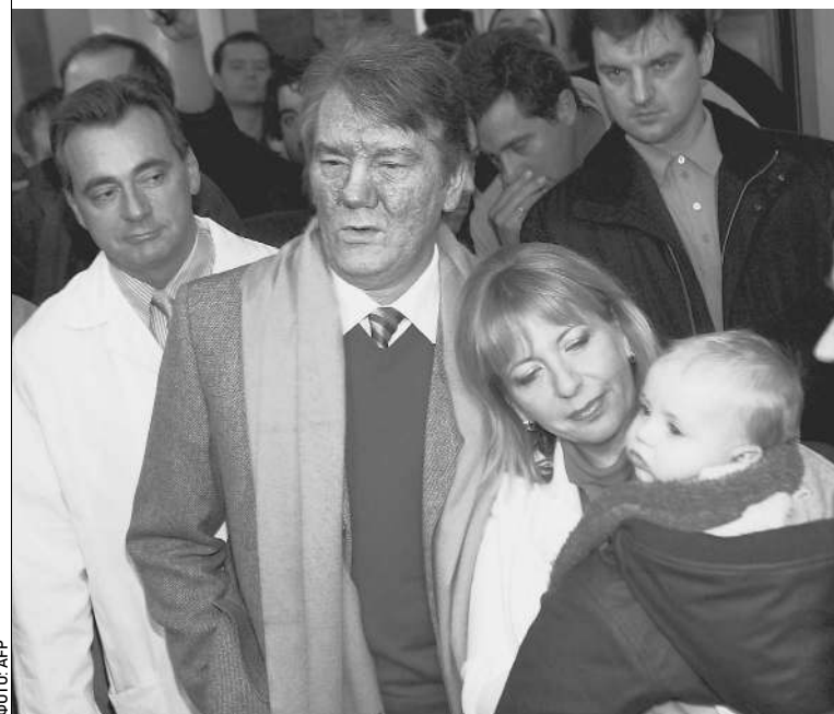
12 декабря 2004 года: пациент Виктор Ющенко покидает венскую клинику «Рудольфинерхаус»

Характерно, что никого не волнует главный вопрос — чем же действительно болен президент Украины? Рассмотрим болезнь Ющенко исключительно с медицинских позиций. → стр. 8