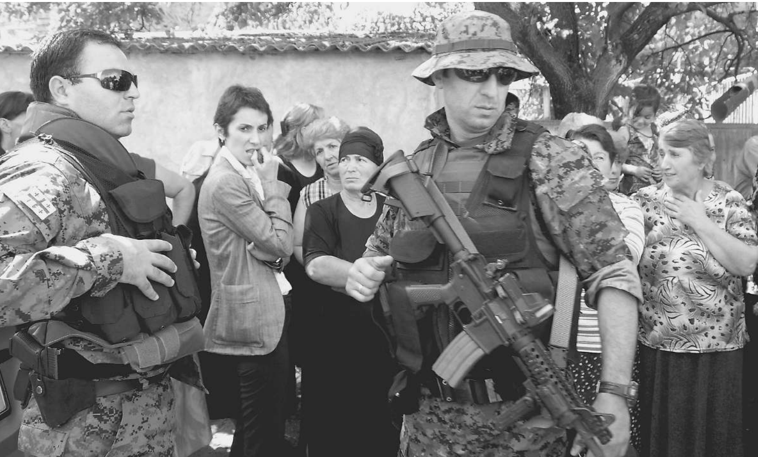
ГРУЗИНСКИЕ ВОЕННЫЕ готовы прийти в Южную Осетию с оружием. Американским

Грузинская артиллерия бьет прямой наводкой по селам Южной Осетии. Наш спецкор Юрий Снегирев передает с необъявленной войны