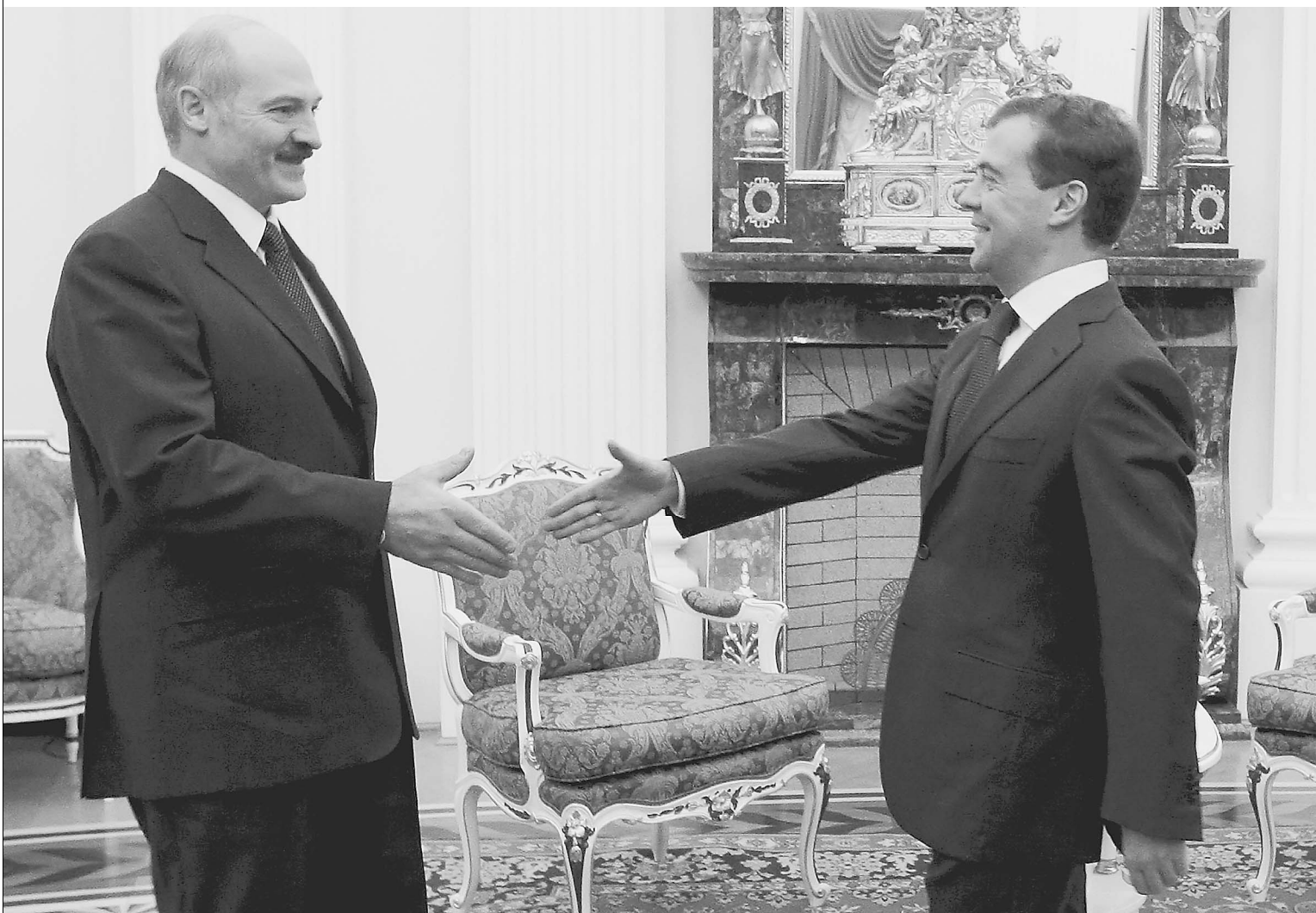
Александр Лукашенко к Дмитрию Медведеву не шел с протянутой рукой

Газ для Белоруссии будет дешевым, переход на рубли ускорится