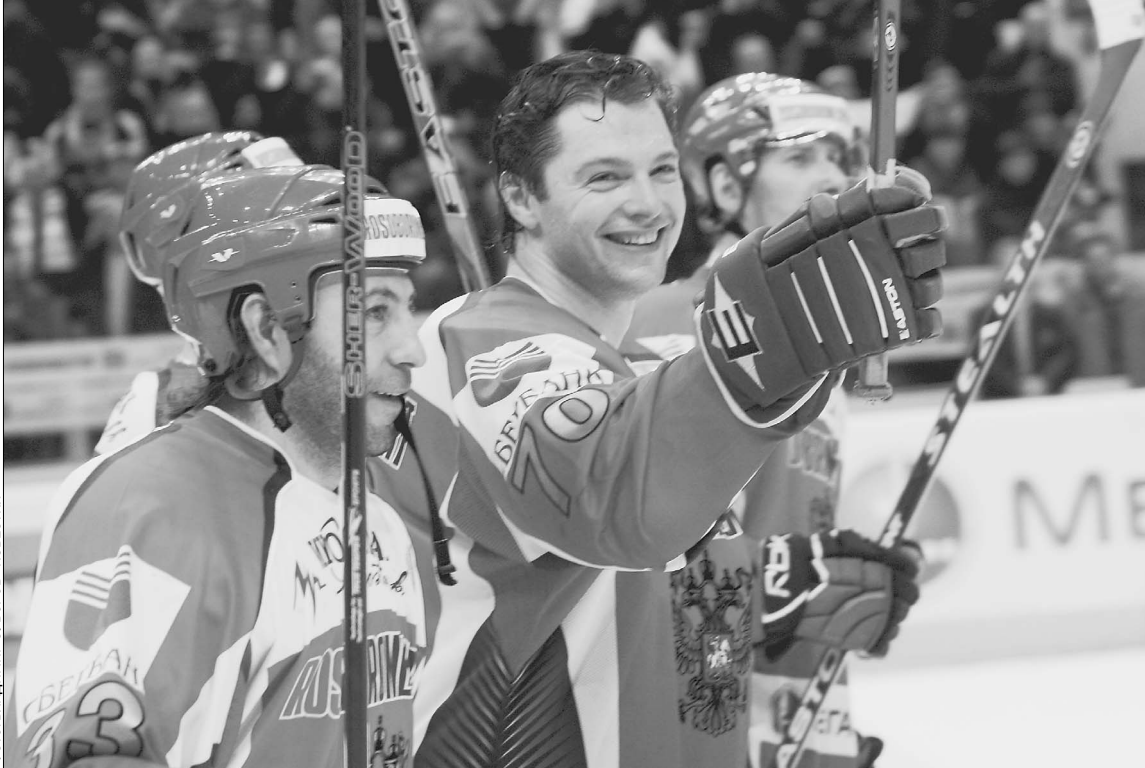
Звезды сборной простились с болельщиками на Кубке «Первого канала». Надолго ли?

Едва сборная России триумфально завершила Кубок «Первого канала», как член совета директоров Континентальной хоккейной лиги Игорь Ларионов выступил с сенсационным заявлением. По его словам, лига намерена уже со следующего сезона запретить игрокам из КХЛ выступать за национальные команды на этапах Еврогуга. Судя по всему, это не частная инициатива Ларионова, а четко сформированная позиция, которую также поддерживают Вячеслав Фетисов и глава профсоюза игроков Андрей Коваленко. Если она будет реализована, уже на следующем московском турнире болельщики вместо лучших игроков страны увидят в составе сборной молодых, неоперившихся юнцов из второго эшелона российского хоккея. → стр. 11