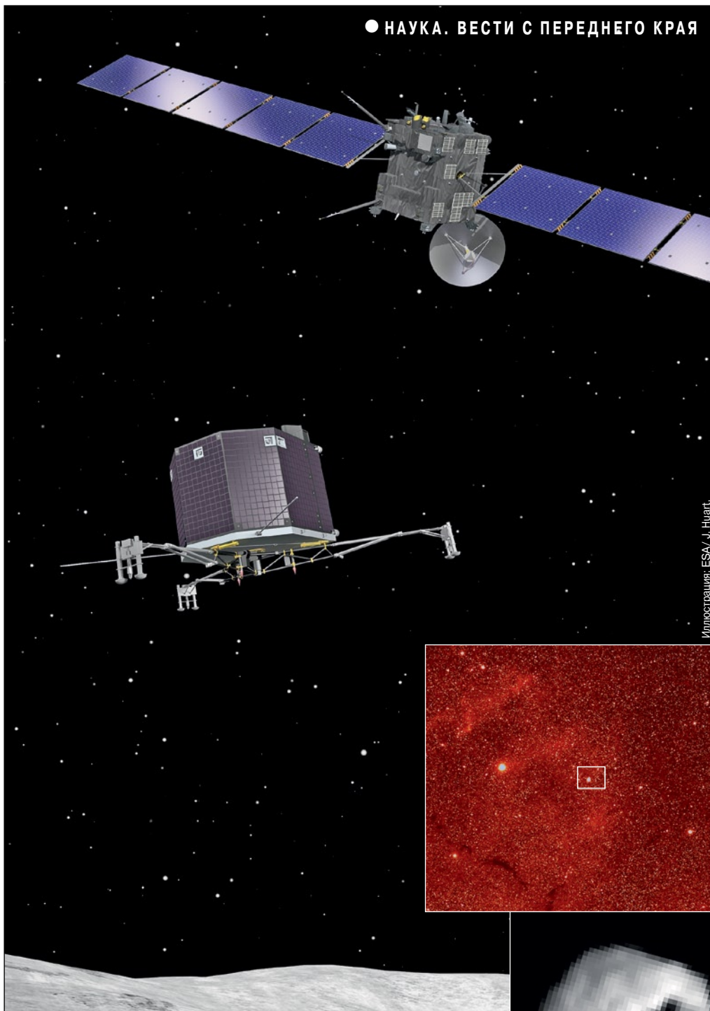
Иллюстрация: ESA/ J. Huart.