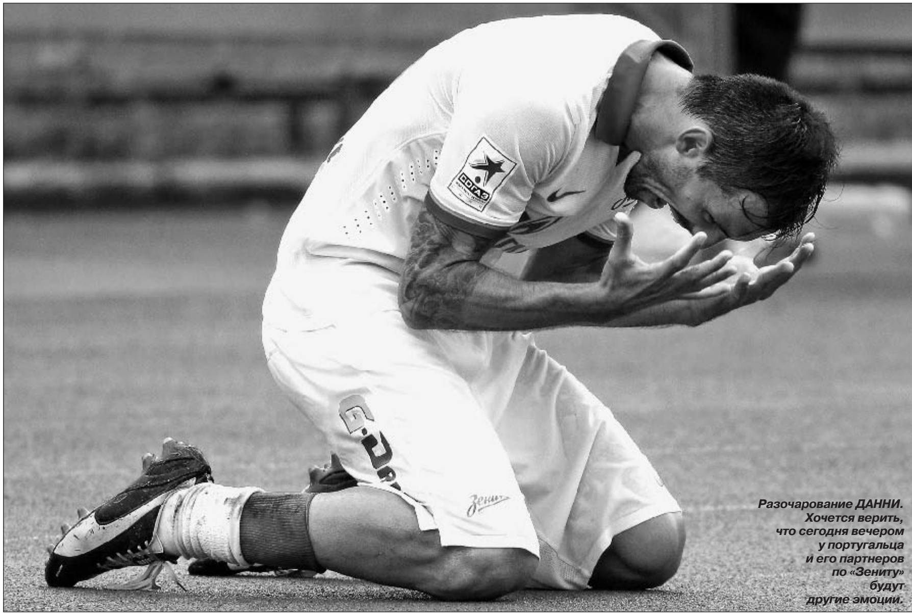
Разочарование ДАНИ. Хочется верить, что сегодня вечером у португальца и его партнеров по «Зениту» будут другие эмоции.

К ответному матчу с «Норшелланном» вице-чемпионы России подходят не в лучшем состоянии. Сможет ли победа над датским клубом повлиять на атмосферу в «Зените», ключевые фигуры которого, похоже, «поплыли»?