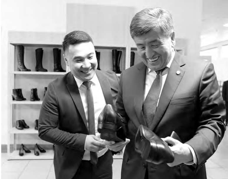
ПРЕСС-СЛУЖБА ПРЕЗИДЕНТА КР

Президент Киргизии Сооронбай Жээнбеков посетил обувную фабрику в Чуйской области и, убедившись в хорошем качестве ее продукции, приобрел себе пару ботинок. На предприятии глава республики побывал во время рабочей поездки по региону. Фабрика открыта благодаря поддержке Российско-Киргизского фонда развития.