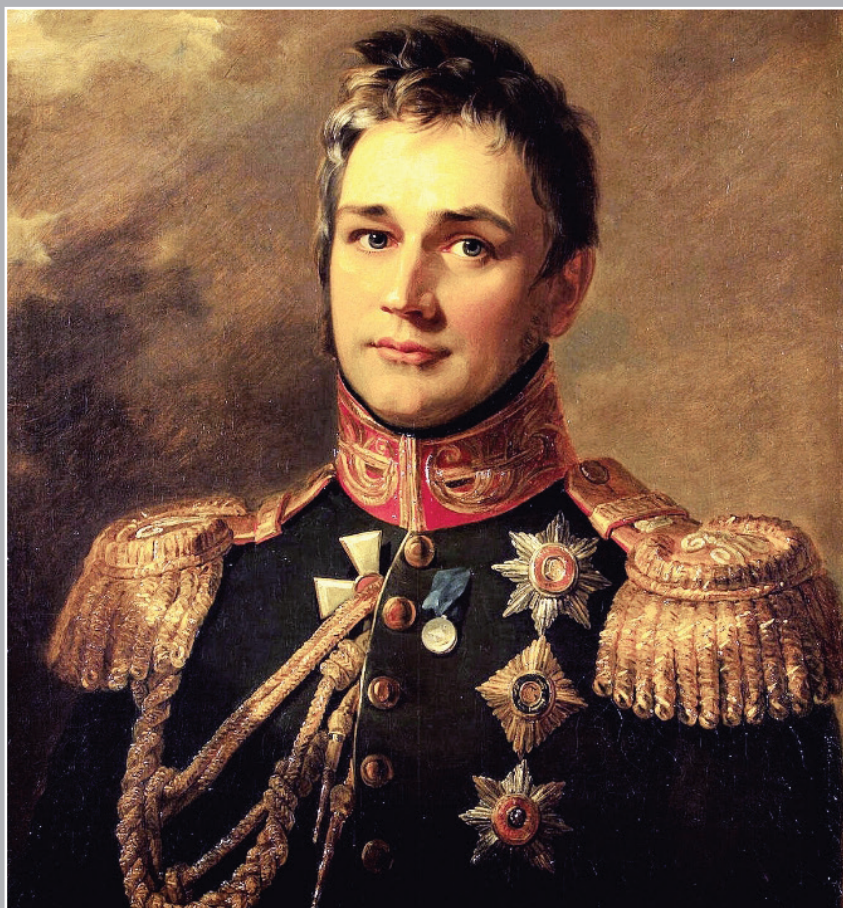
МИХАИЛ СЕМЕНОВИЧ ВОРОНЦОВ