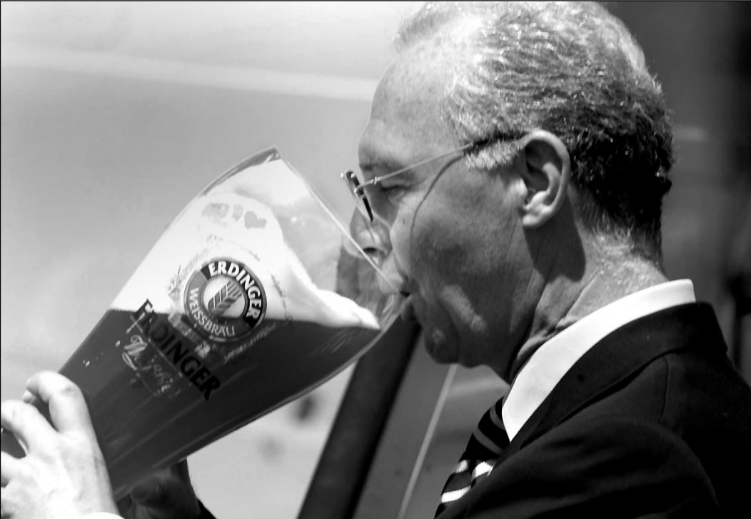
Вчера. Мюнхен. Мариенплац. Президент клуба Франц БЕККЕНБАУЭР, или просто Кайзер Франц, пьет за успех «Баварии».

Кан, держа в левой руке привезенный из Милана трофей, а в правой — огромный бокал с пивом Erdinger, во всю мощь закричал: «Через четверть века мы снова привезли в Мюнхен главный клубный Кубок». Многотысячный хор с площади ответил ему песней: «We are the champions!»